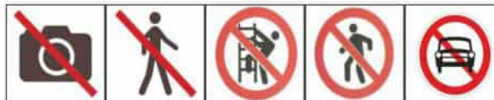
请勿拍照 No Photography