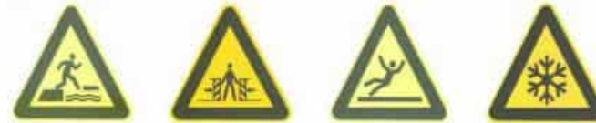
当心落水 Warning falling into water