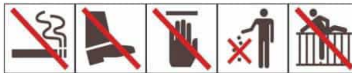
请勿吸烟 No Smoking