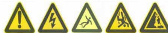
注意安全 Warning danger