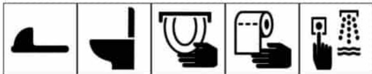
蹲便器 Squatting Toilet